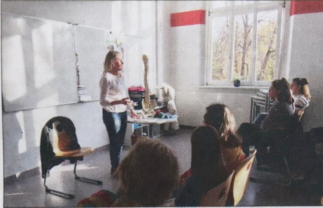
Die Schülerinnen der IGS Wallstraße ...